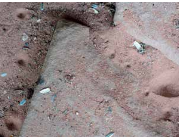
Trichter des Ameisenlöwen ... verschiedene Larvenstadien haben verschiedene Größen