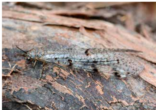
Die Gefleckte Ameisenjungfer gut getarnt auf einem Ast

Aber zunächst wieder zurück zur Larve, dem Ameisenlöwen. Der Name hört sich ja schon etwas gefährlich an und das ist er auch! Zumindest für kleine bis mittelgroße Insekten, Spinnen etc., die in die Nähe des selbst gebauten Sandtrichters kommen. Im feinen Sand baut die Larve diese Trichter, an deren unterem Ende sie sitzt und auf Beute wartet. Krabbelt ein kleines Insekt – wie die namensgebende Ameise – dann vorbei und rutschen ein paar Sandkörner in den Trichter, so löst dies sofort einen Reiz beim