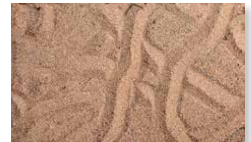
Kriechspuren von Ameisenlöwen im Sand