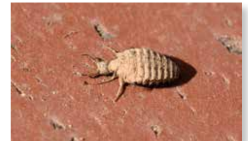
Ameisenlöwe: die Larve der Gefleckten Ameisenjungfer

Sicher haben Sie beim Wandern schon einmal kleine, nur wenige Zentimeter Durchmesser messende Trichter im feinen Sand gesehen? Nun, diese gehören zu einer Larve eines sehr interessanten Insekts aus der Gruppe der Netzflügler, dem Ameisenlöwen. So nennt man die Larve der Ameisenjungfer, die sehr unscheinbar und auch ein äußerst heimliches, nachtaktives Leben führt. Eine Möglichkeit, diese einmal zu sehen ist meist nur, wenn sie im Sommer in ein hell erleuchtetes Zimmer fliegt – die Tiere sind nämlich positiv phototaktisch, fliegen also zum Licht. Im Englischen heißen übrigens beide, die Larve und das fertige Insekt, antlion.