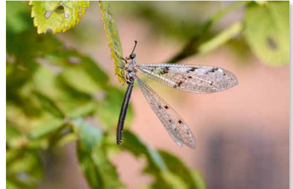
Die Gefleckte Ameisenjungfer in voller Pracht!

Sicher haben Sie beim Wandern schon einmal kleine, nur wenige Zentimeter Durchmesser messende Trichter im feinen Sand gesehen? Nun, diese gehören zu einer Larve eines sehr interessanten Insekts aus der Gruppe der Netzflügler, dem Ameisenlöwen. So nennt man die Larve der Ameisenjungfer, die sehr unscheinbar und auch ein äußerst heimliches, nachtaktives Leben führt. Eine Möglichkeit, diese einmal zu sehen ist meist nur, wenn sie im Sommer in ein hell erleuchtetes Zimmer fliegt – die Tiere sind nämlich positiv phototaktisch, fliegen also zum Licht. Im Englischen heißen übrigens beide, die Larve und das fertige Insekt, antlion.